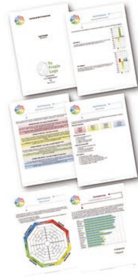
La imagen no muestra el informe completo, sólo algunas páginas